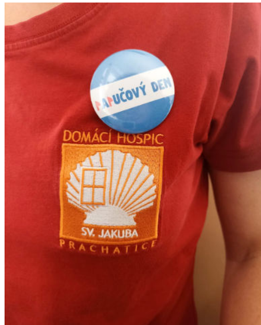
Do terénu v papučích s Domácím hospicem sv. Jakuba