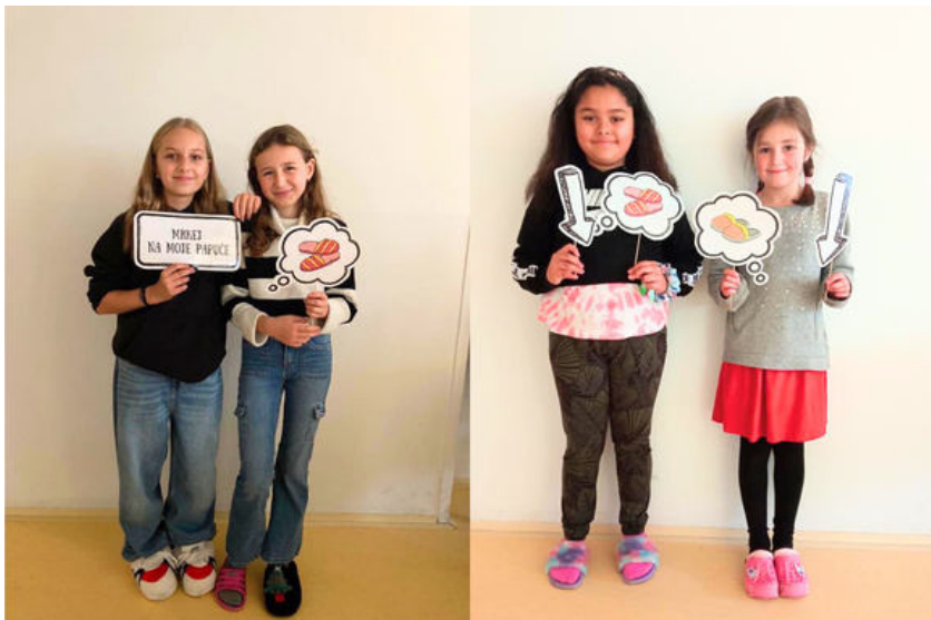
Zapojení dětí s Domácím hospicem sv. Víta

K připomínce důležitosti domácí hospicové péče se v rámci Papučového dne připojili i naše Domácí hospice . Každý pojal tento den jiným způsobem, ale v papučích vyrazili všichni.