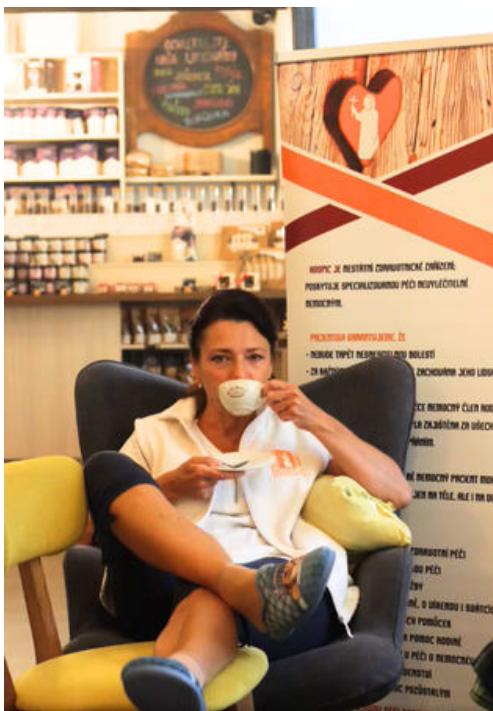
Papučový den v pražárně Drahonice s Domácím hospicem sv. Markéty